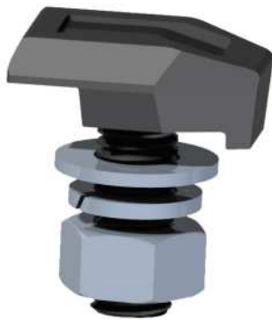
Bridas forjadas Forged Clips